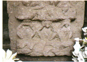
像の下部の拡大写真

今回は農園の一角に立つ こうしんとう 庚申塔をご紹介します。 この庚申塔は、古くは人見街道と呼ばれた道路と、村内の道との三叉路の所に造立されたもので、宝暦4年(1754年)10月に上高井戸村の講中15人によって造立されました。