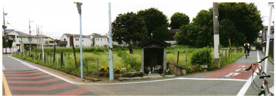
三叉路から庚申塔を望む