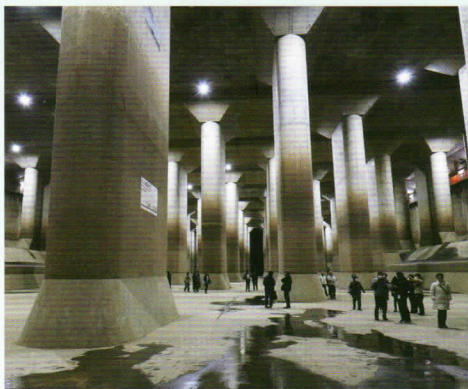
首都圏外郭放水路(防災地下神殿)

雛祭り展が開催されていた「人形博物館」では、伝統産業の歴史と変遷、技能の継承、保存・修復などを学ぶ良い機会となりました。また「首都圏外郭放水路」では、域内の洪水被害軽減を目的とした地下放水路のメカニズムの理解や巨大な調圧水槽(防災地下神殿)の見学を通して、防災対策の重要性を実感できた意義深い一日となりました。